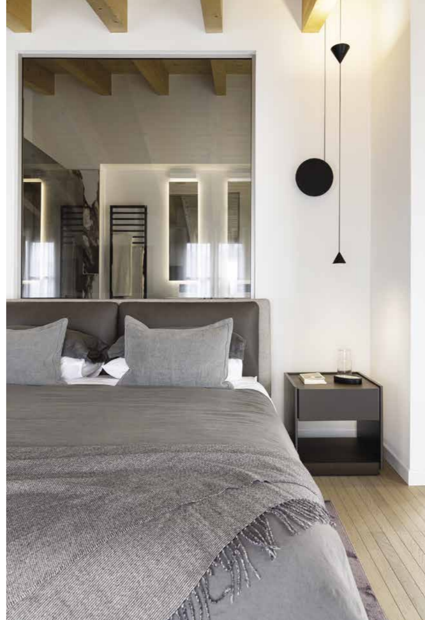
Atmosfera zen per la camera padronale con bagno dedicato, caratterizzata da una continuità spaziale data dall'apertura a vista posta sopra la testata del letto, come uno schermo. La nuance naturale del pavimento ( Derada ) accompagna con delicatezza e personalità gli arredi minimali della camera.