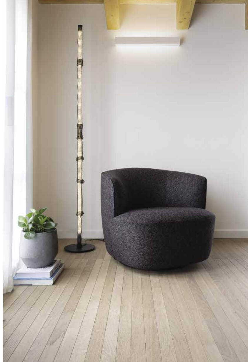
La texture calda e vellutata del parquet sottolinea anche la zona lettura rendendola calda e accogliente ( Derada ).